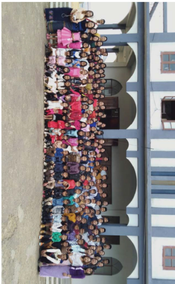
KHAWTHAI S KOHHRAN NAUPANG SUNDAY SCHOOL